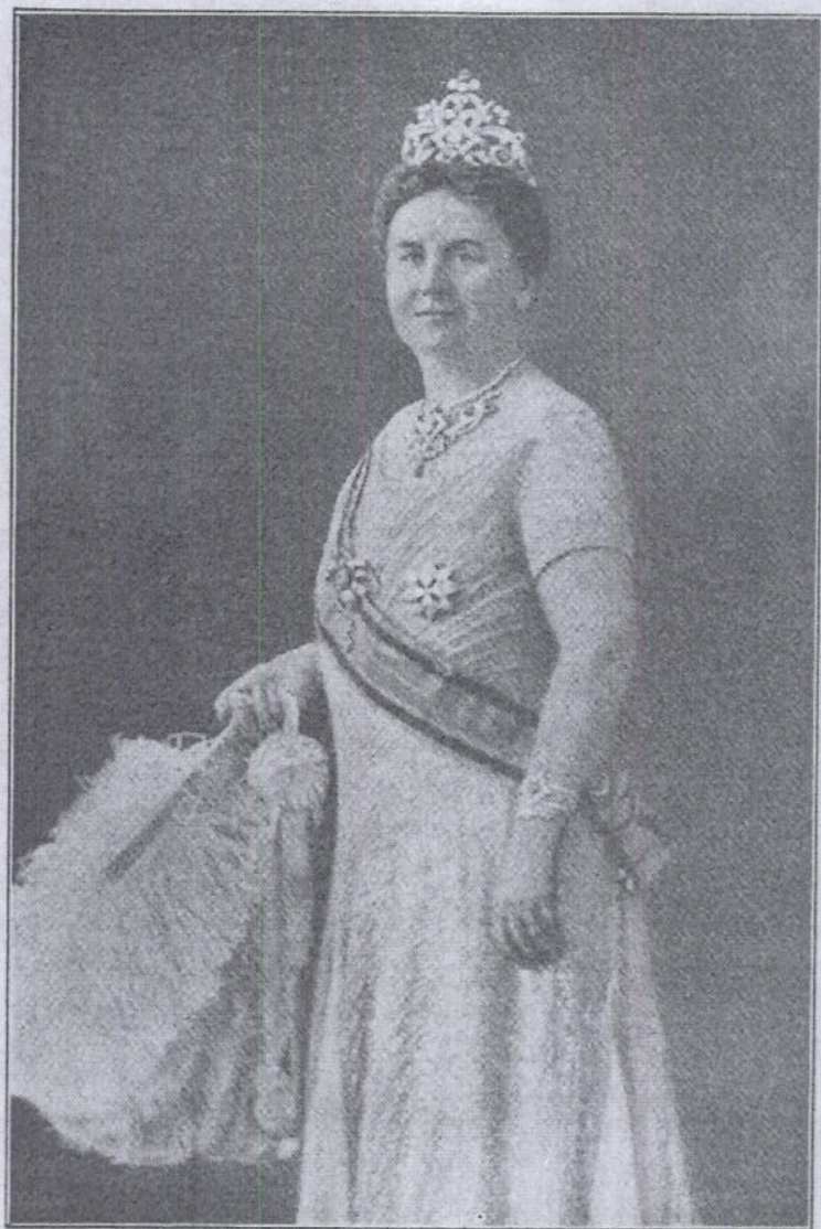
H. M. Koningin Wilhelmina